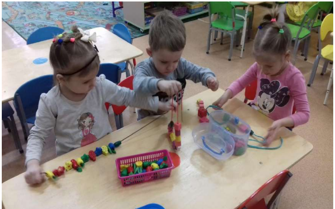
Дидактическая игра «Собери бусы»