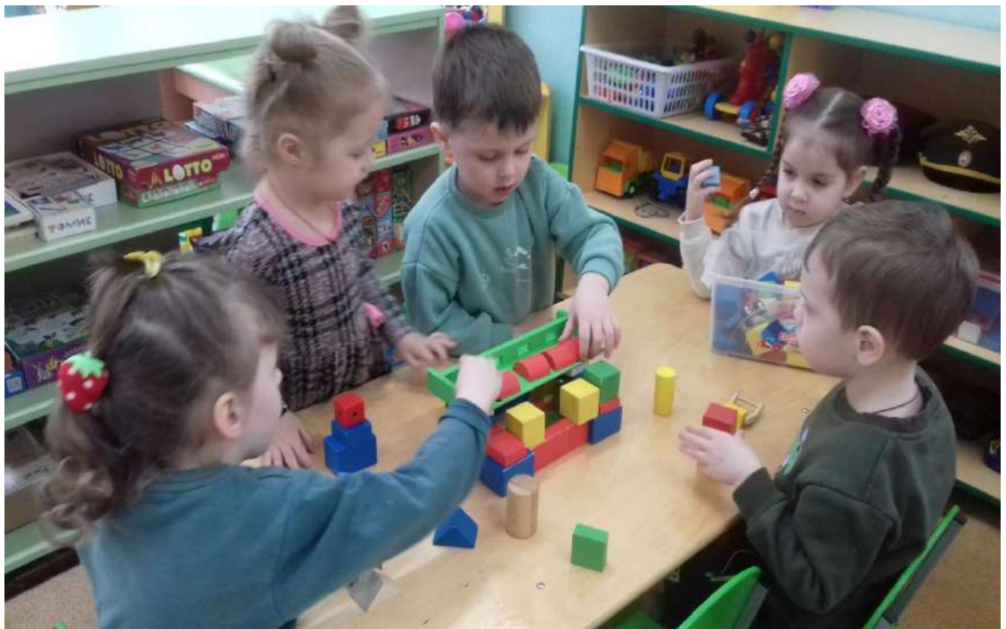
Постройка: - «Красивый домик для мамы».