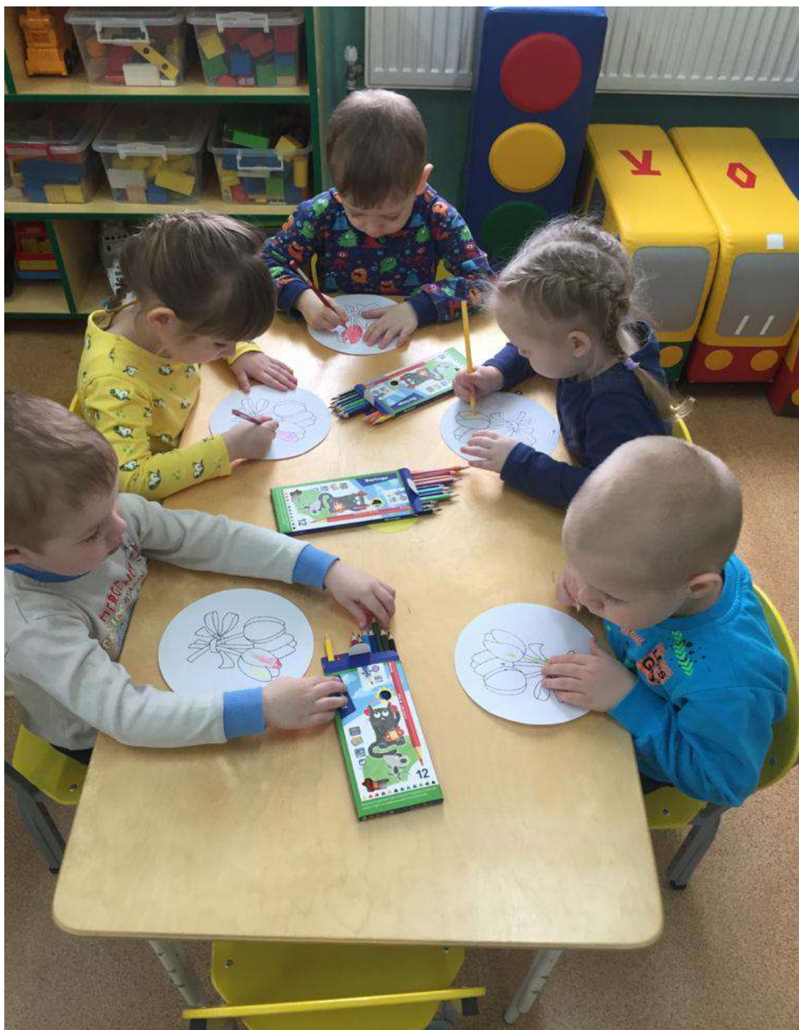
Рисование «Красивая тарелочка для бабушки»