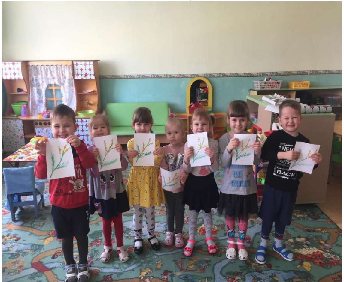
Лепка « Веточка мимозы»