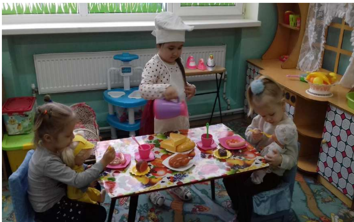
«В гостях у мамы»