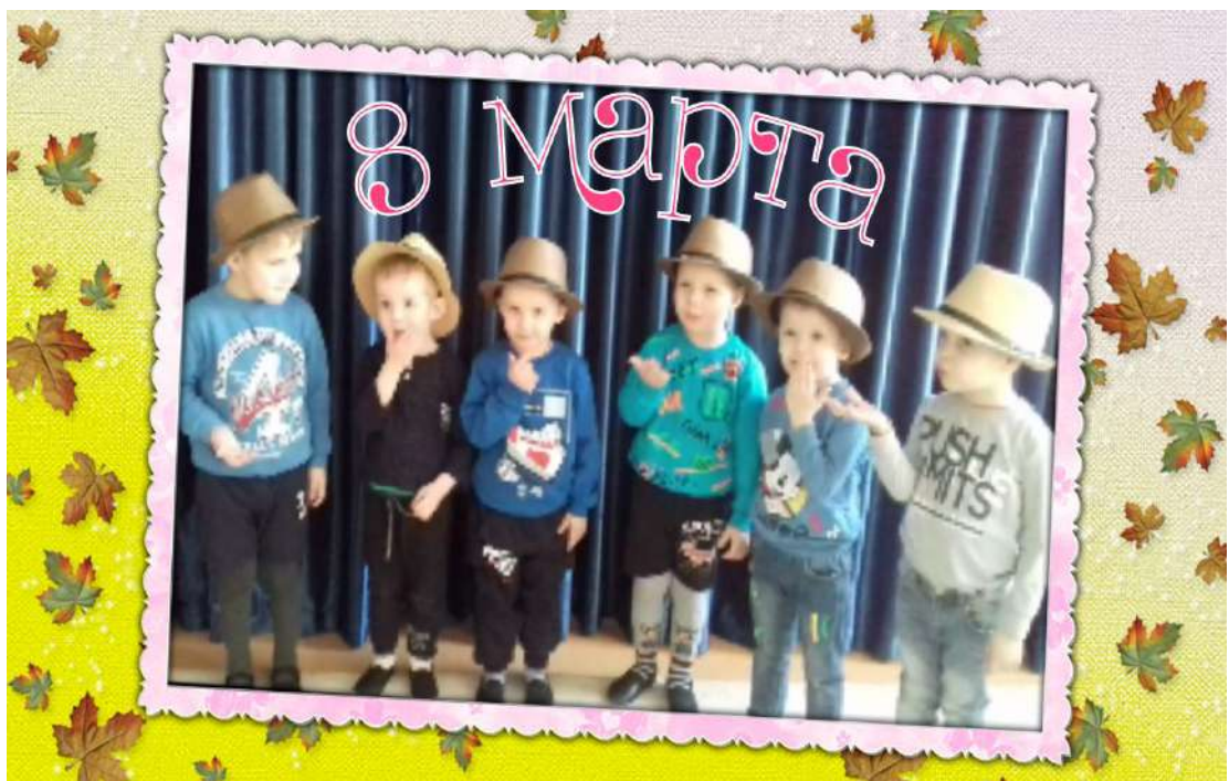
«Стихи о маме»