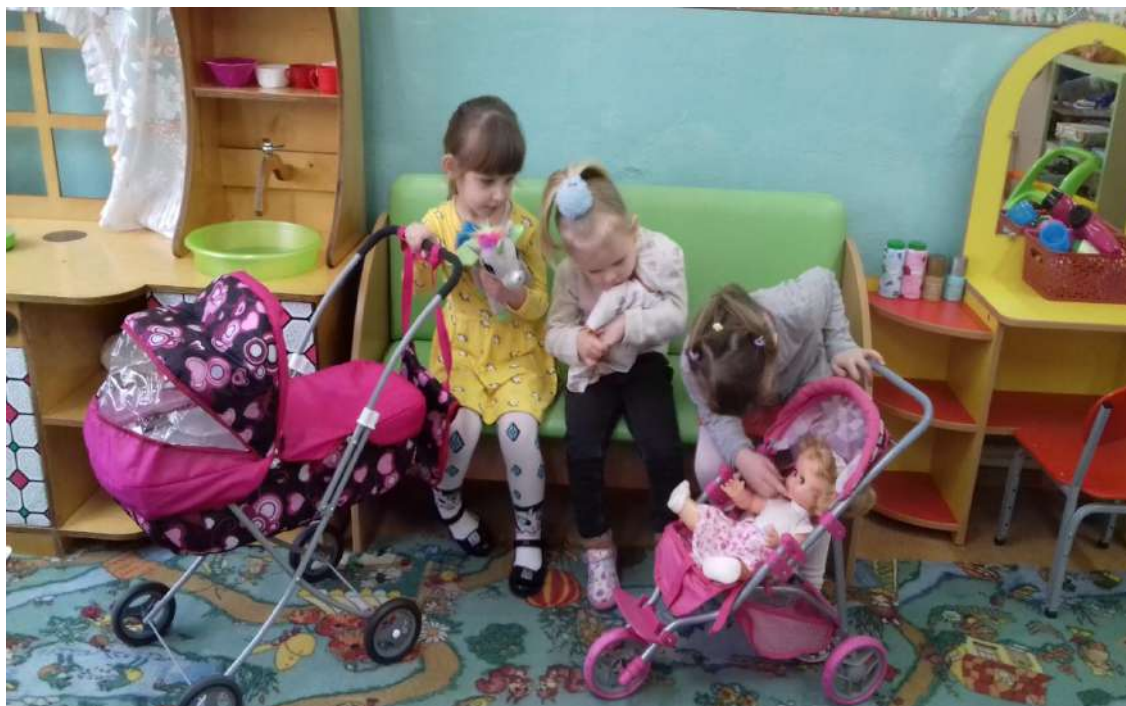
Наблюдение «Мамы на прогулке с малышами»