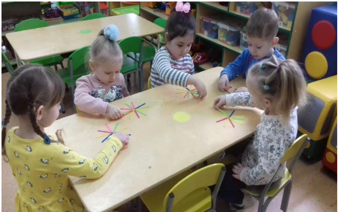
Развивающая образовательная ситуация на игровой основе: - «Сделаем цветочек из счетного материала в подарок маме».