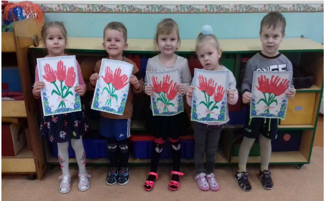
Рисование: - «Тюльпаны для мамы»