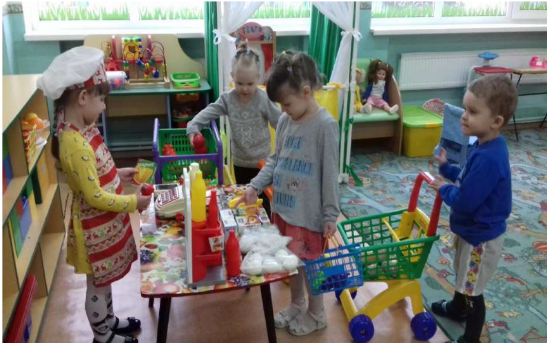
«Мама на работе»