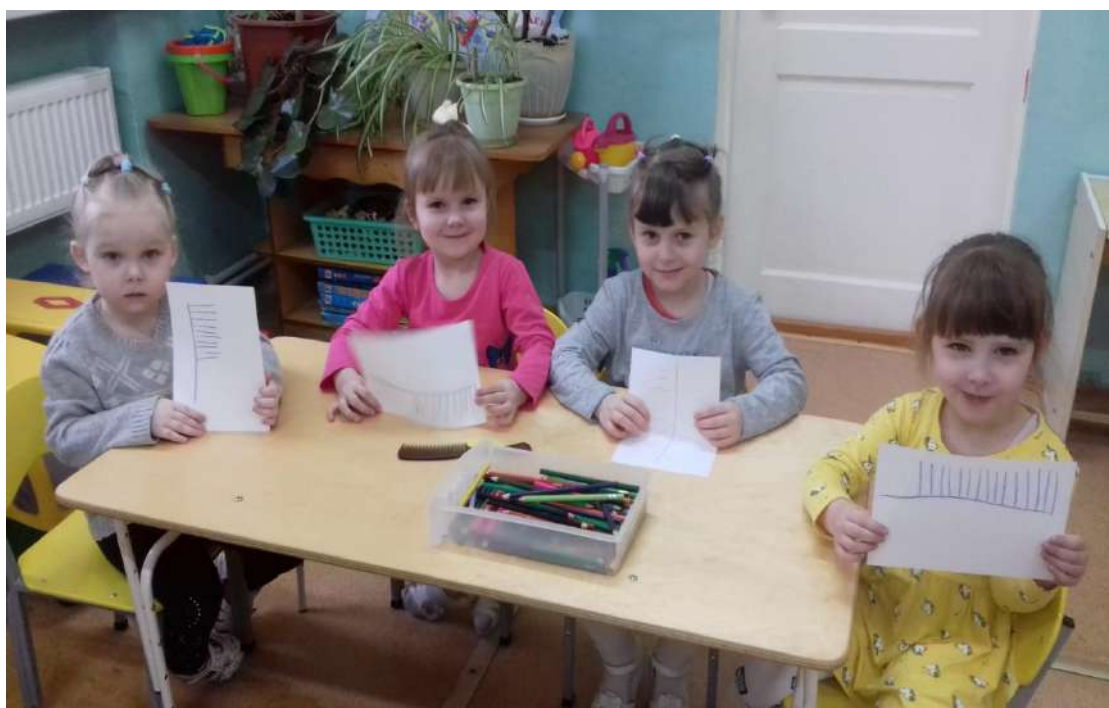
«Расчёска для мамы»