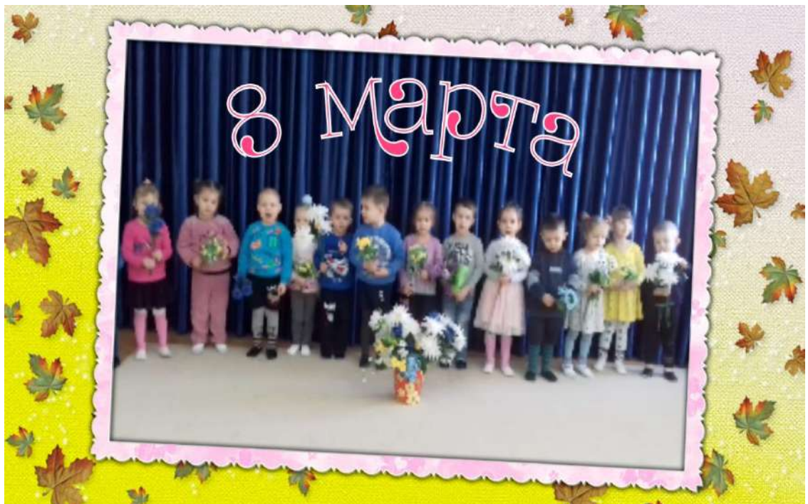
Песня «Мамочка милая мама моя»